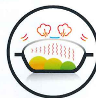
3. Kochen & Pasteurisieren