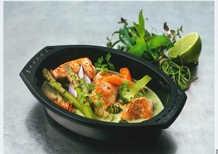
Die Ansprüche der Konsumenten an Convenience-Lebensmittel sind hoch. Les exigences des consommateurs à l'égard des produits convenience sont très élevées.

Das kontinuierliche Micvac-Verfahren basiert auf der Mikrowellentechnologie, welche direkt auf die Endverpackung und somit Portionsgrößen von 200g bis 1.5kg angewendet wird. Dadurch kann die Koch- bzw. die Pasteuri-